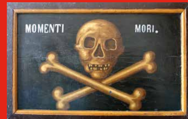
▲ Memento mori "Recorda que has de morir" Retauló. Pintura sobre taula, fusta Segle XVII Museu Etnogràfic de Ripoll