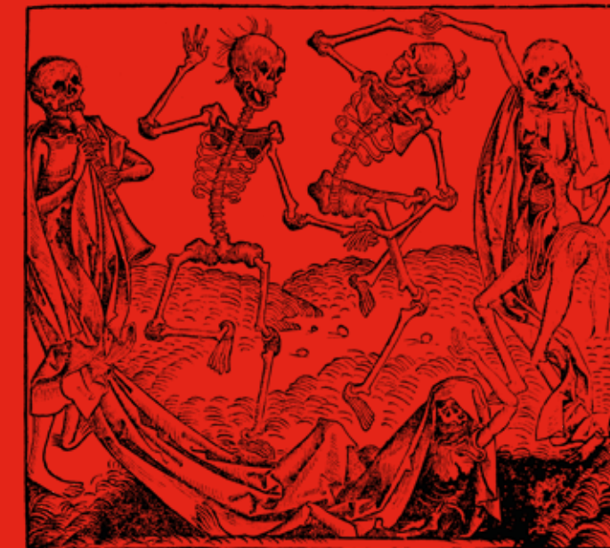
▼ Dansa macabra. Schedel Hartmann, Liber Chronicarum. Nuremberg. Anthonius Koberger, 1493