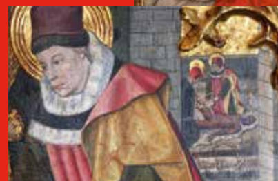
▲ A i B. Detall de la Pradel·la dels sants Cosme i Damià. Retaule dels sants Abdó i Sinén. Seu d'Egara. Església de Sant Pere de Terrassa. Segle XV. Museu de Terrassa. L'escena representa dues seqüències. En darrer terme, els sants metges practiquen l'amputació d'una cama a un pacient. En primer terme, es pot apreciar com els metges col·loquen una pròtesis de fusta al malalt.