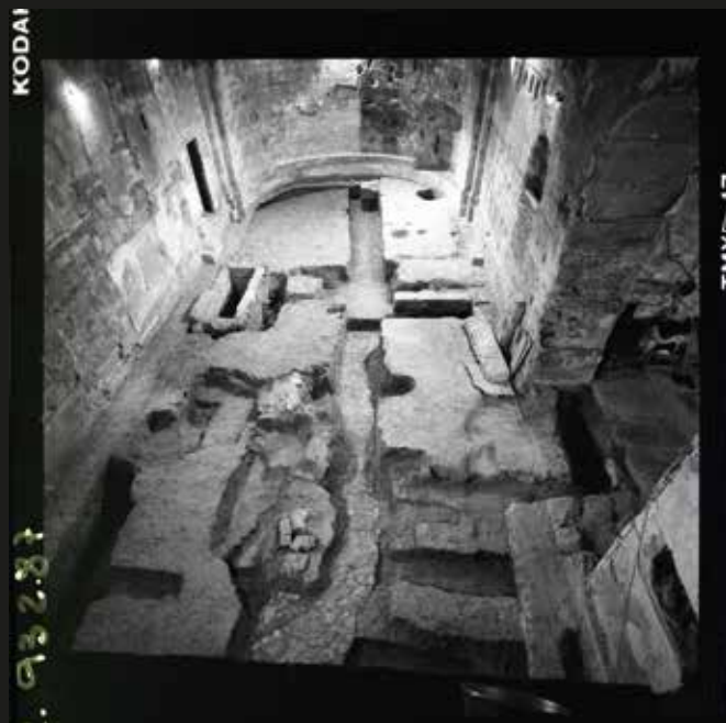
▲ Sant Llätzer (Barcelona). Vista de les intervencions arqueològiques. Foto: Joan Francès, 1990. Fons documental del Servei del Patrimoni Arquitectònic Local. Diputació de Barcelona